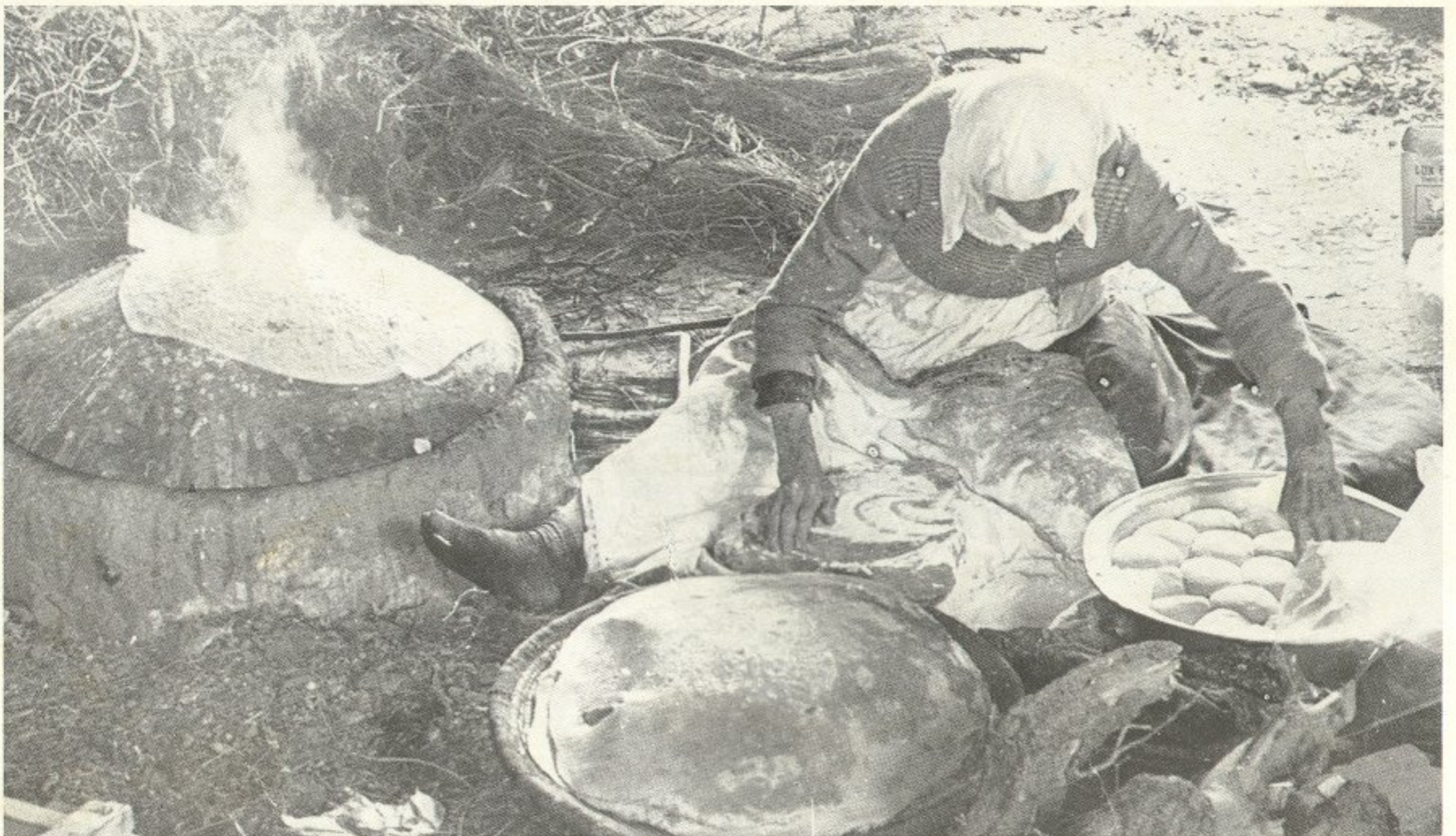
Livet er begynt å vende tilbake enkelte steder i Syd-Libanon, som dette bildet fra Fouckhar viser.