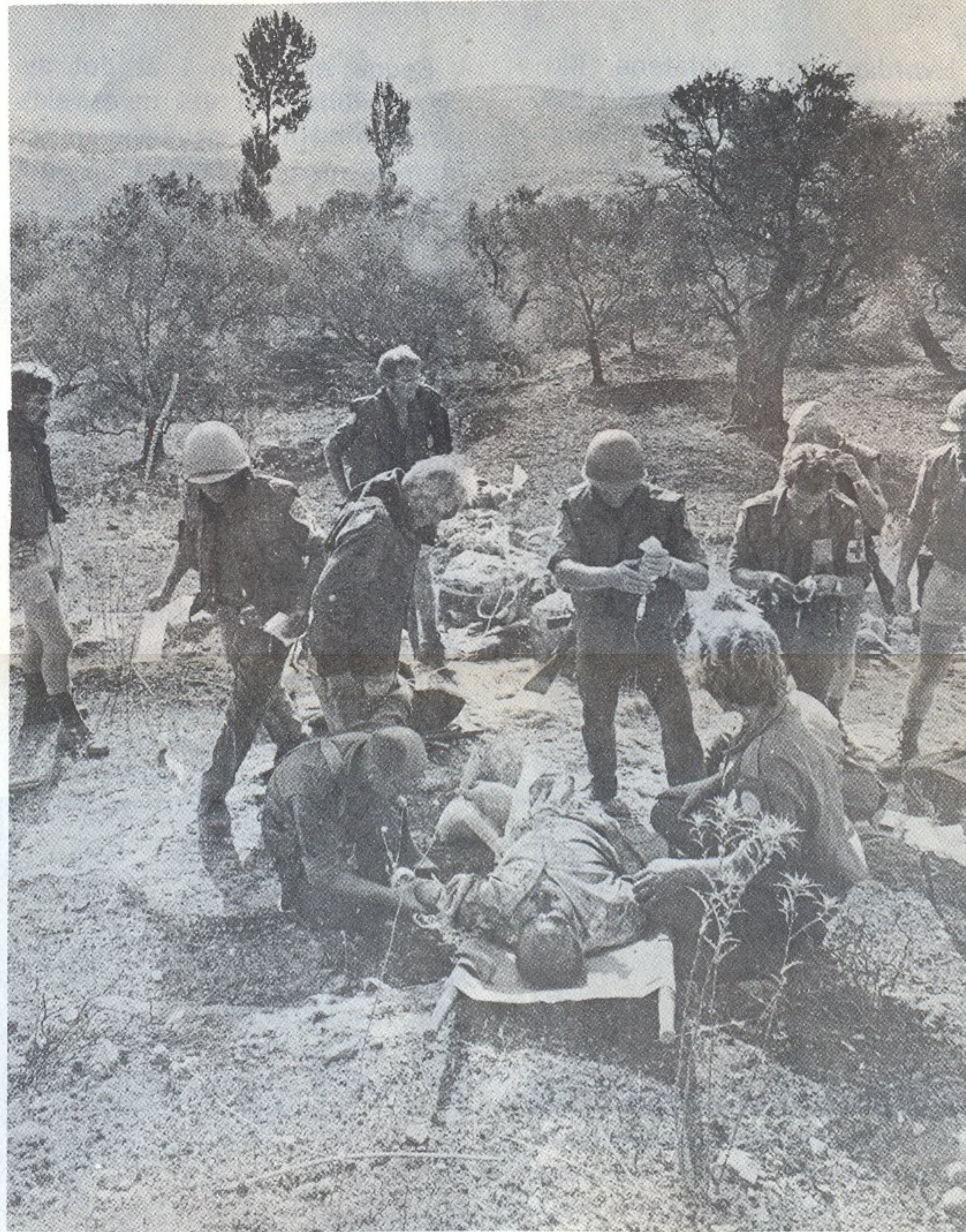
Sanitetstroppen i aksjon på ulykkesstedet.