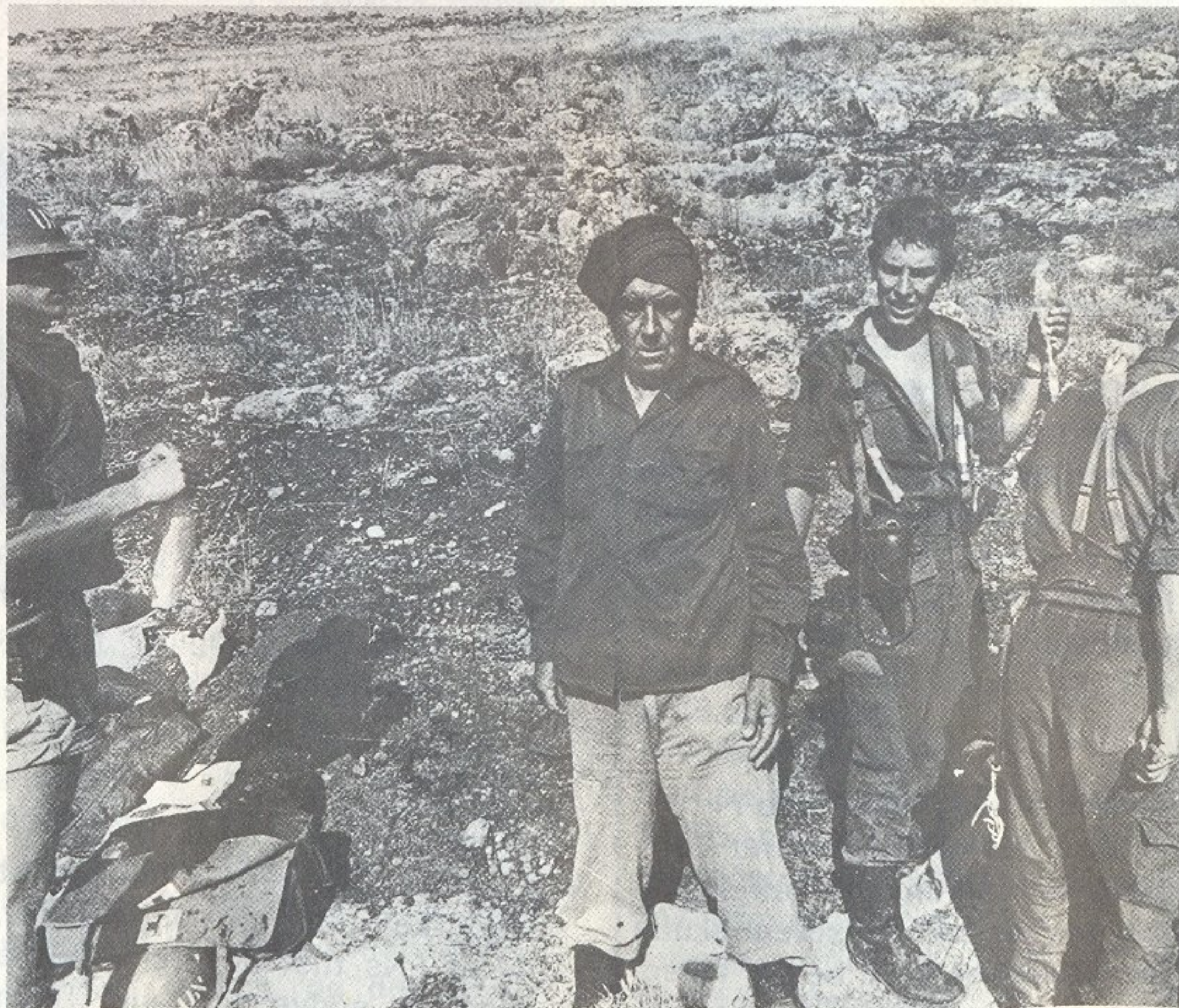
Sivilpersonen på bildet står fortvilet og apatisk på ulykkesstedet mens sanitetsfolkene arbeider med den sårede.