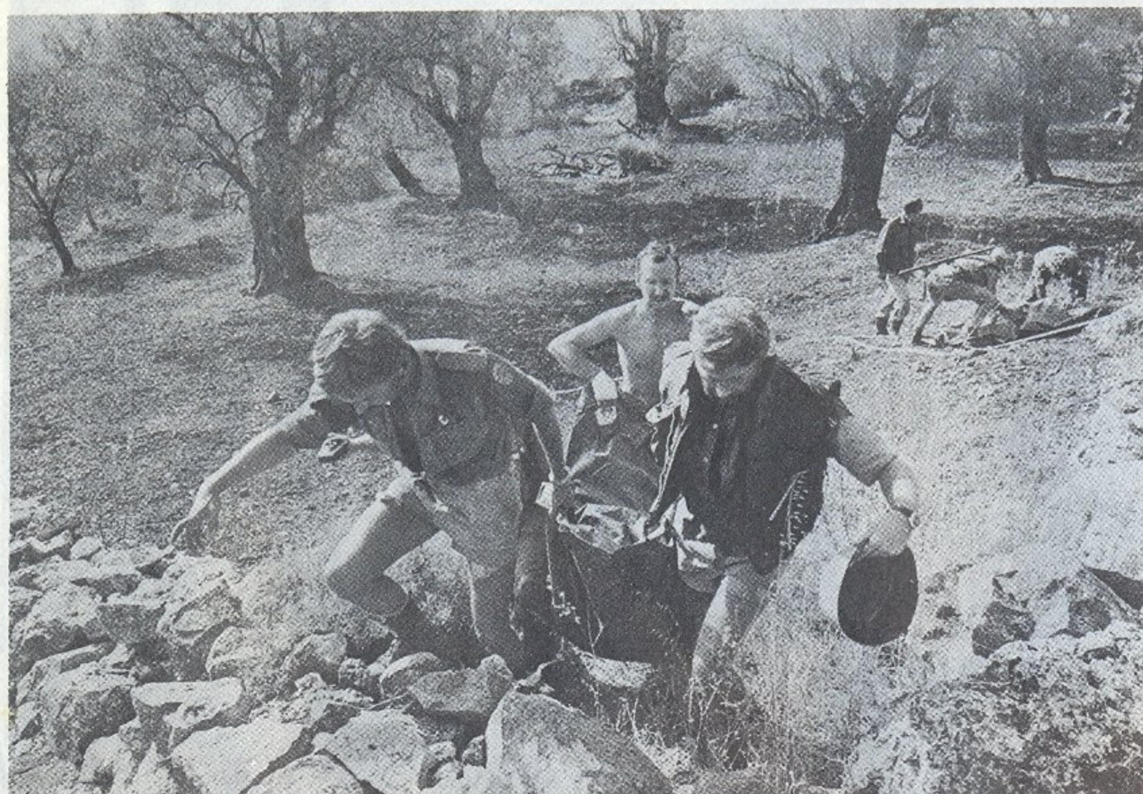
De to døde bæres ut av området etter ulykken den 17. juli. Sorgen var stor blant sivilbefolkningen da ulykken ble kjent.