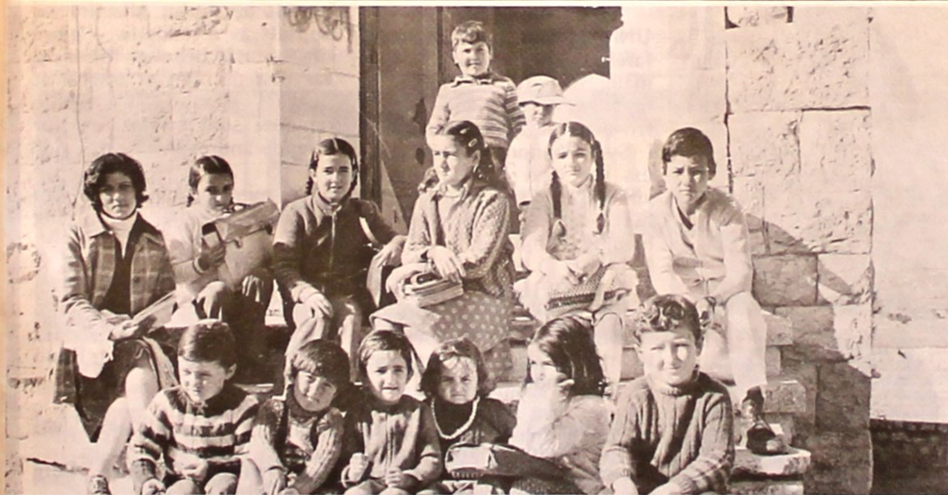
Skolen i Saqi samlet foran på kirketrappen første skoledag.

Vi ser med glede at anstrengelsene med å få til skole i Ebel Es Saqi endelig er lyktes. Innsatsen som ligger bak tiltaket er felles fra UNIFIL, NORBATT, og sivile, både i Ebel Es Saqi og i Beirut og Sidon. Det å start en skole er ikke helt enkelt i det krigsherjede området. De mest iøyenfallende mangler er selvfølgelig skolehus, utstyr og böker. Men også lærekrefter og nödvendige formaliteter måtte tilveieskaffes för man kunne sette igang.