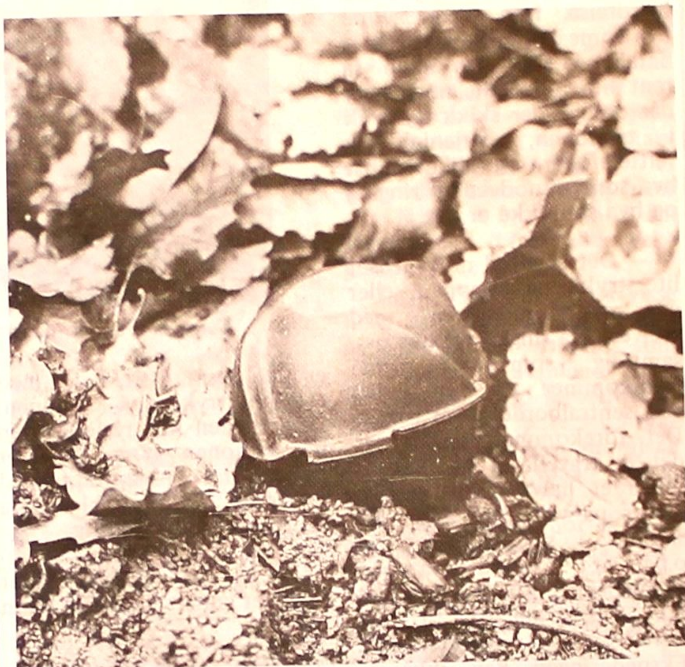
Rapporter straks om du finner denne bomben, men rör den ikke!

– Se opp for cluster-bomben, advarer pi-troppens sjef, löjtnant Sortdal, og ber innstandig om at slike bomber ikke under noen omstandighet rörs om de finnes. Vi har klart å få fatt i bilde av bomben, og bringer det herved til orientering. Farven er lys grå-grönn, og størrelsen er som en tennisball. Karakteristisk er de små "vingene" som setter bomben i rotasjon når den slippes fra fly. Denne rotasjonen armerer bomben og får den til å eksplodere i luften. Men dersom beholderen disse bombene ligger i når de slippes fra fly, ikke åpner seg höyt nok over bakken, vil bombene falle til marken uten å bli sprengt. Likevel er ofte sammenstötet med bakken da sterkt nok til å foreta den manglende armering. Bomben har omkring 200 splinter, og ved den minste beröring går den av.