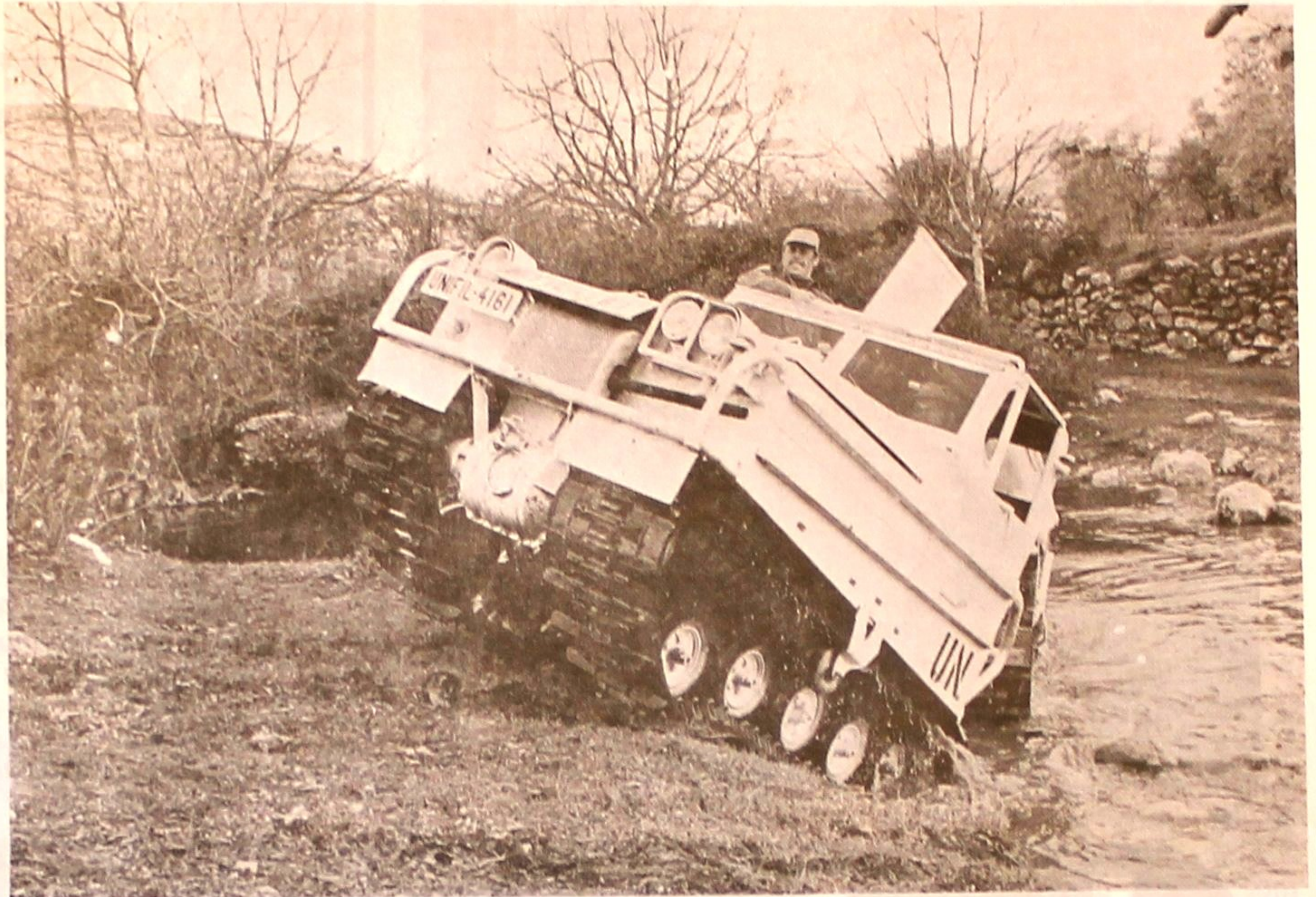
Nyvasket med Hasbanivann kjører en av UNIFILS to bandvogn inn på tørr mark.

Forøvrig, for dem som ikke måtte vite det, er vognene fullt brukbare som terrengkjøretøy, dersom dette skulle vise seg påkrevet.