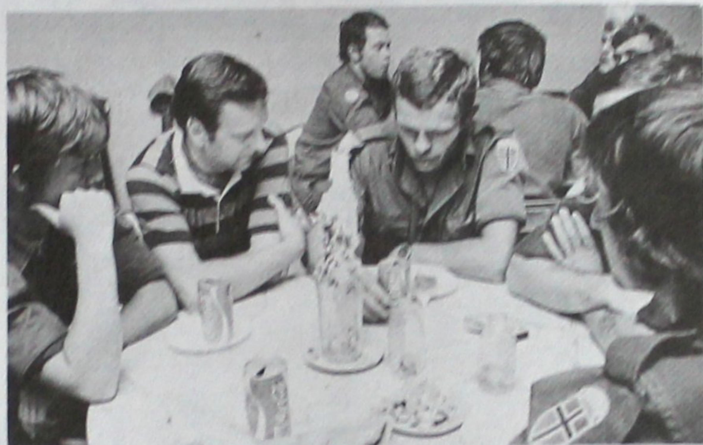
Statssekretær Jørgen Johan Holst (i /stripet skjorte) i uformell samtale med NORBATT-soldater på Ludvigs Bar.