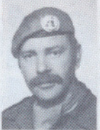
KAPT H. O. NES VELF OFF