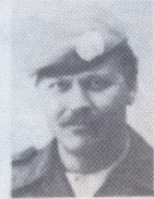
LT S. O. STAVE KANTINE BEST