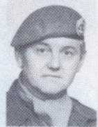
LT A. SVARSTAD PRESSE/INF OFF