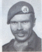
FENR J. R. ILLEÅS ASS KANTINEB