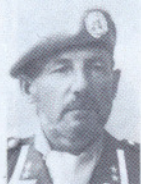
OBL T. L. G. NILSEN NK BN