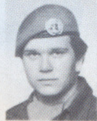
FENR E. STRØMSTAD ASS PRESSEOFF