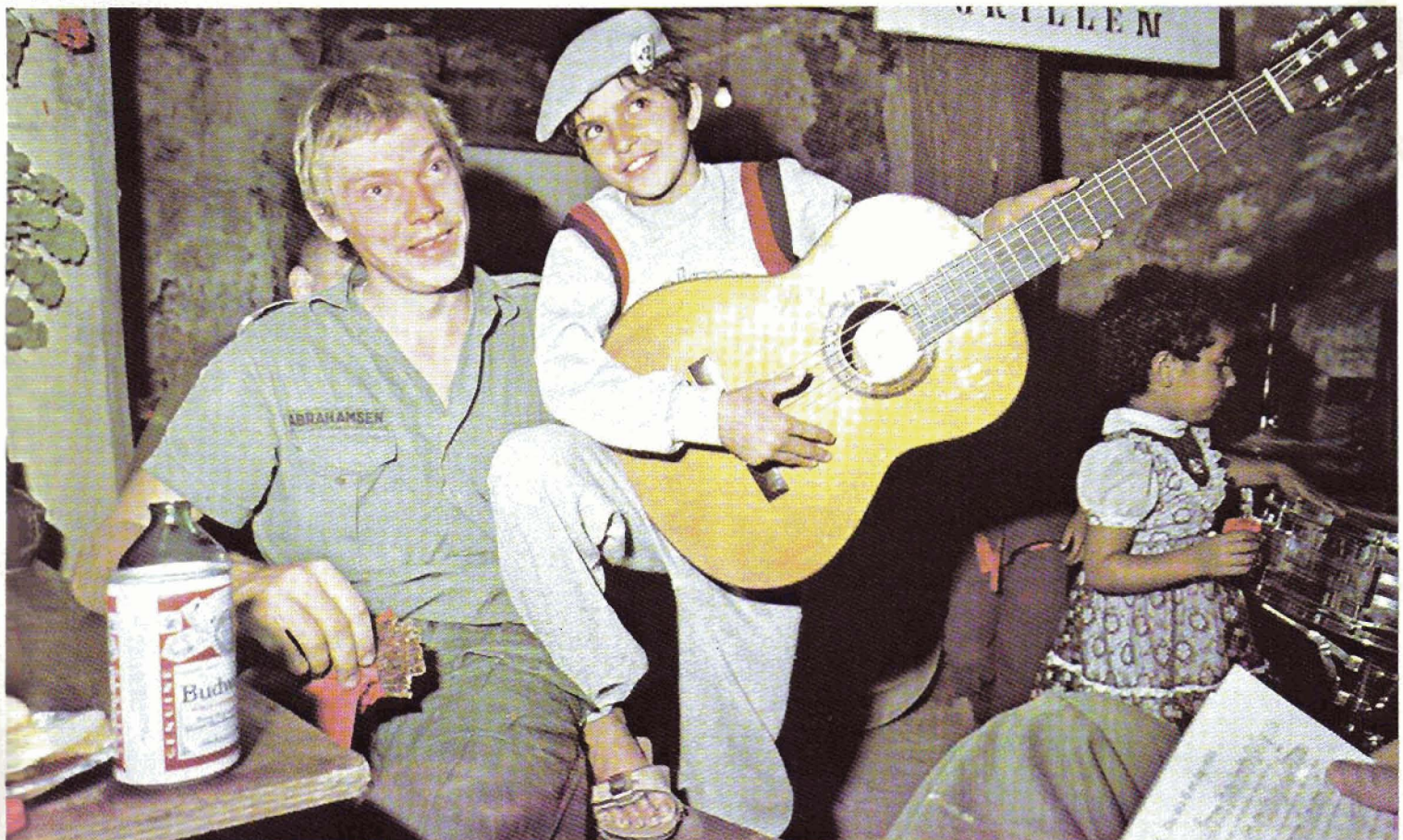
Mangt et vennskap har oppstått i løpet av de seks månedene i Libanon, også mellom militære og sivile. Bildet er fra en fest på Martini-høyden.