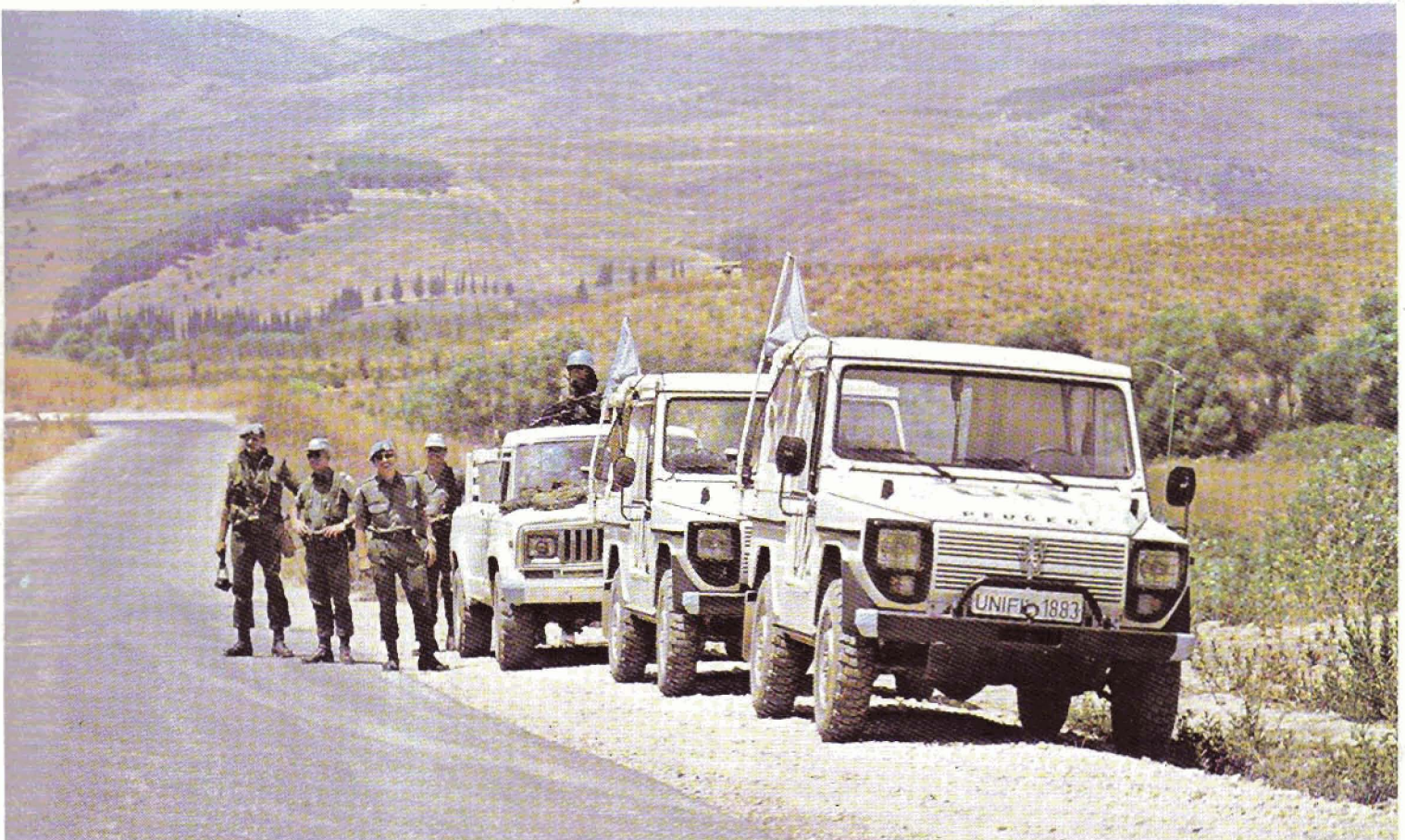
Kolonner har hørt til dagens orden gjennom seks måneder for mange av oss. Bildet er tatt ved en av Norbatts enklaveposisjoner.